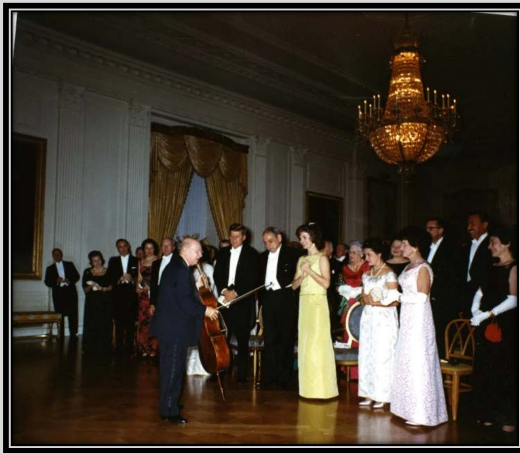
Pau Casals ante el Matrimonio Kennedy, 1961